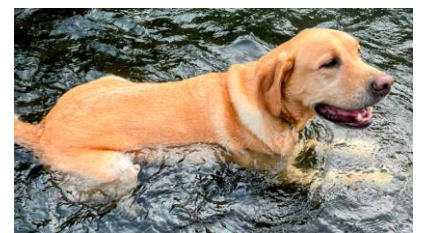
夏の風物詩。近所の川で。犬も暑いよね…。